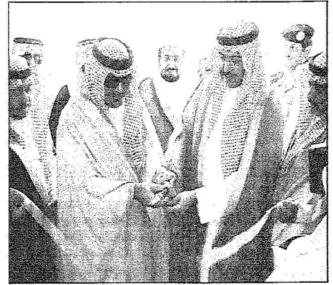
الأمير عبدالعزيز بن ماجد والأمين فيصل بن عبدالله يشعان المركز