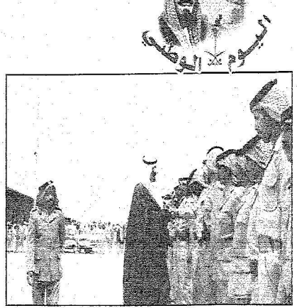
الله عبدالله يصاحبه عدد من مسؤولي الحرس

تشكل في ٧٤ هـ والأمير عبدالله الفيصل الفرسان أول رئيس له