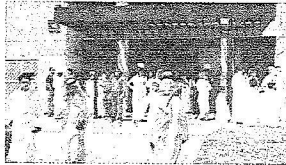
هيئة التدريس في إحدى الكليات الجديدة

تحت إشراف وزير التعليم العالي الدكتور خالد بن محمد العبدون، تم افتتاح 63 كلية جديدة في 14 جامعة حديثة في المملكة العربية السعودية، وذلك في إطار خطة الوزارة لتوسيع نطاق التعليم العالي وتوفير فرص تعليمية أفضل للطلاب. وتأتي هذه الكليات الجديدة في مجالات متنوعة تشمل العلوم الإنسانية، والعلوم الطبيعية، والهندسة، والطب، وغيرها. وتتميز هذه الكليات بأبنية حديثة ومجهزة بأحدث التقنيات التعليمية، مما يضمن جودة التعليم المقدمة للطلاب. ويشرف على هذه العملية الدكتور خالد بن محمد العبدون، وزير التعليم العالي، الذي أكد على أهمية هذه الخطوة في تعزيز مكانة المملكة العربية السعودية كمركز للتعليم والبحث العلمي في المنطقة.