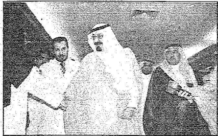
الملك عبدالله خير داعم لتفريق الطبي والجراحي