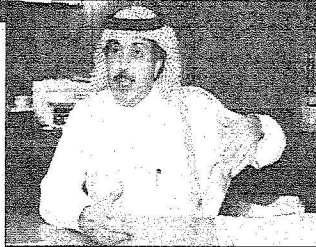
الرائد: انتهاء سوق الأسهم موجود في كل العالم