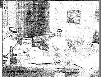
الرائد متحدثاً للزملاء المحررين