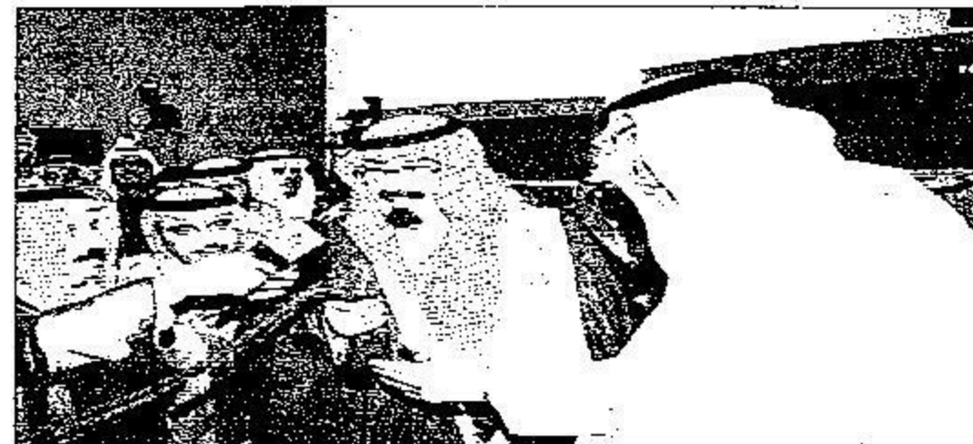
المليك يدلي بتصريحات للصحفيين

حضر الحفل صاحب السمو الملكي الامير متعب بن عبدالعزيز وزير الشؤون البلدية والقروية وصاحب السمو الملكي الامير مقرن بن عبدالعزيز رئيس الاستخبارات العامة وأصحاب السمو الملكي الامراء وأصحاب المعالي الوزراء وكبار المسؤولين من مدنيين وعسكريين.