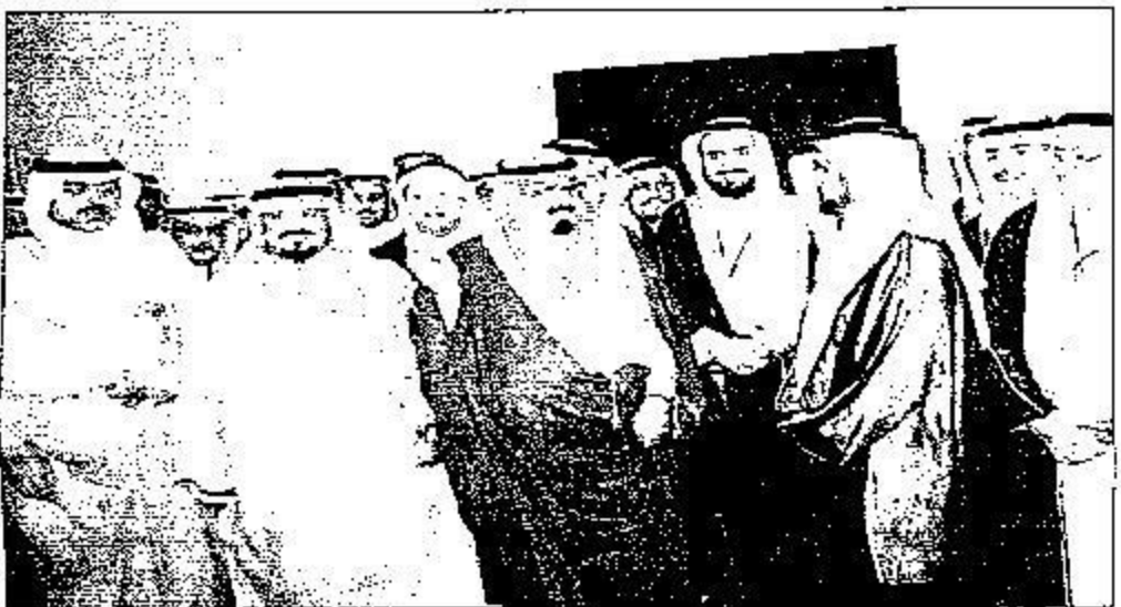
المبارك، وسمو ولي العهد خلال الحفل