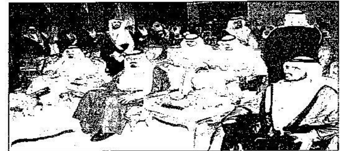
جانب من الحفل