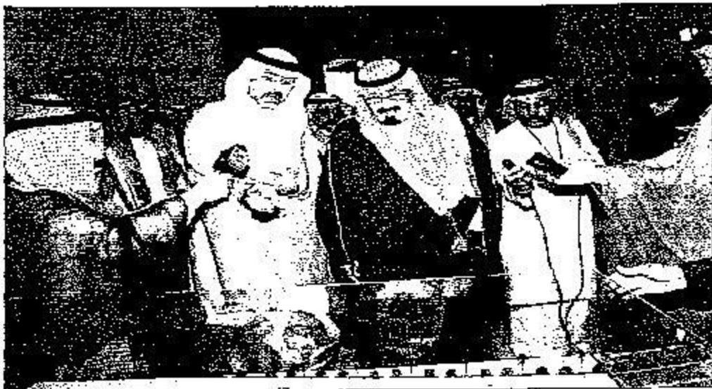
... ويطلع على صياغة الاستثمار