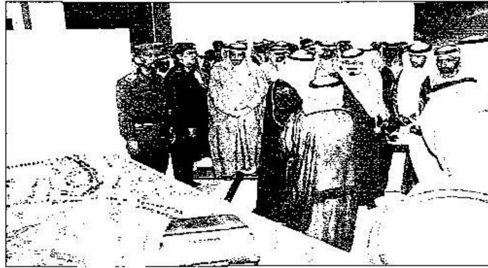
الملك ي دشّن المدينة الاقتصادية في رباغ أحس