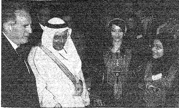
وزير الاعلام والثقافة يرافقه وزير الدولة البريطاني في جولة يعرض الصور التاريخية

والدوادمي، حيث الاستقرار في قصر الضيافة الملكية في البديعة على الضفة الغربية لوادى حنيفة وقاموا بزيارة للرياض ثم (السعودية). وقد وأصلت قافلة الفريق رحلتها من الرياض نحو ساحل المملكة الشرقي على الخليج العربي، وثوقفوا في الأحساء، فالتعير ثم الدمام، ومن هناك أبحروا الى مملكة البحرين، قبل أن يستقلوا الطائرة مغادرين الى القاهرة ثانية ثم العودة منها الى وطنهم.