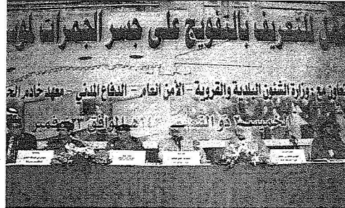
المتحذون في ورشة العمل