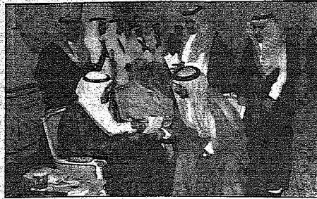
الملك عبدالعزيز يستقبل المواطنين..