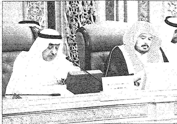
وزير الخدمة المدنية يتحدث امام اصحاء

البنود المؤقتة غير خاضعة للأنظمة الإدارية ولا دور للوزارة فيها