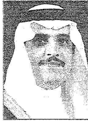
الأمير محمد بن فهد

الشرقية المهندس ضيف الله العقبى بأن الشركة البريطانية المتخصصة التي تعاقدت معها الامانة بدأت اعمالها يوم السبت الثاني والعشرين من شهر شوال الماضي وقامت بمعاينة الموقع على الطبيعة والذي تطلب اغلاق النفق الجزئي لمدة ساعة لكل اتجاه لعمل المعاينات اللازمة وتم الاطلاع على الوثائق والمستندات الخاصة بالتصميم والتنفيذ تمهيداً لاستكمال الدراسة المطلوبة وتقييم الحالة الفنية وتحديد أسباب المشكلات وطرق العلاج لها - كما قامت الامانة بتشكيل لجنة فنية تضم عدداً من المهندسين بوكالة التعمير والمشاريع وكذلك جامعة الملك فهد للبترول والمعادن متخصصين في هندسة التربة وهندسة المنشآت تكون مهامها مناقشة التقرير النهائي الذي سوف تقدمه الشركة