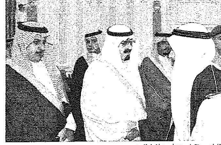
الملك يستقبل عددا من المواطنين

الأستاذ عبدالحسن بن عبدالعزيز التويجيري وعضو مجلس الشورى عبدالرحمن الغداد. من ناحية أخرى استقبل خادم الحرمين الشريفين بقصر اليمامة أمس دولة رئيس وزراء العراق السابق الدكتور إياد علاوي. وحضر الاستقبال صاحب السمو الملكي الأمير سعود الفيصل وزير الخارجية وصاحب السمو الملكي الأمير مقرن بن عبدالعزيز رئيس الاستخبارات العامة وصاحب السمو الملكي الأمير عبدالعزيز بن عبدالله بن عبدالعزيز مستشار خادم الحرمين الشريفين وصاحب السمو الملكي الأمير عبدالعزيز بن فهد بن عبدالعزيز وزير الدولة عضو مجلس الوزراء رئيس ديوان رئاسة مجلس الوزراء ومعالى مستشار خادم الحرمين الشريفين الأستاذ عبدالحسن بن عبدالعزيز التويجيري.