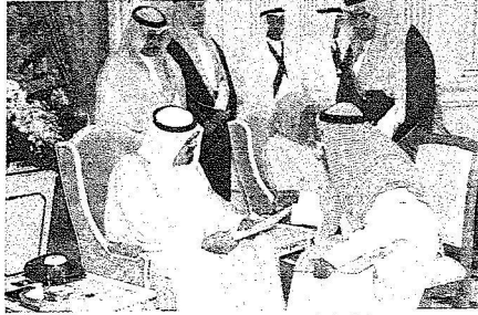
يستعرض بعض طلبات المواطنين

عبدالعزیز مستشار خادم الحرمين الشريفين وصاحب السمو الملكي الأمير عبدالعزيز بن فهد بن عبدالعزيز وزير الدولة عضو مجلس الوزراء ورئيس ديوان رئاسة مجلس الوزراء ومعالى رئيس مجلس الشورى الدكتور صالح بن حميد ومعالى مستشار خادم الحرمين الشريفين