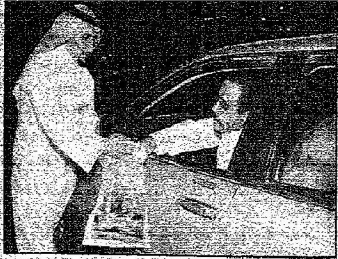
استقبال التبرعات في الطرقات

المصدر : الرياض التاريخ : 24-10-2005 العدد : 13636 الصفحات : 7 المسلسل : 26