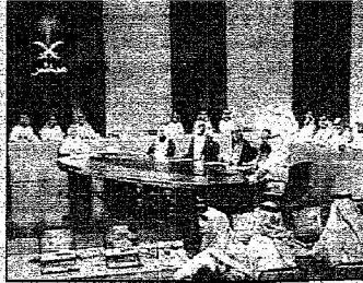
استمارة الحملة في التلفزيون