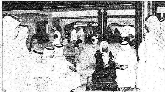
بعض ذوي العائدين

المتحدث الأمني: استكمال إجراءات إبلاغ ذويهم والالتقاء بهم