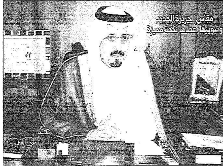
مقاس الجزيرة الجديد وتبويبها أعطاءه كتحفة مميزة