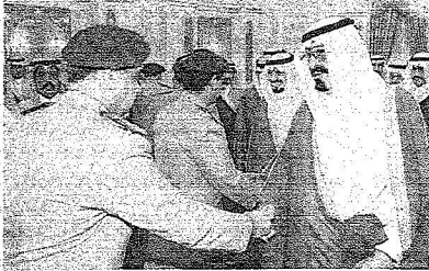
وكبار الضباط والعسكريين