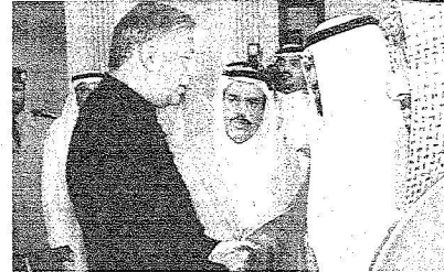
خادم الحرمين الشريفين يتلقى تعازي رئيس وزراء باكستان