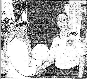
□ تصوير - حسين الدوسري