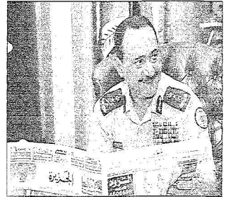
الأمير عبدالرحمن الفيصل يتصفح خبراً عن القوات الجوية في «الجزيرة»

بفضل الدعم الكبير فإن قواتنا الجوية مستمرة في التطوير والتحديث