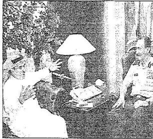
الأمير عبدالرحمن الفيصل يتحدث لزميل عرض القحطاني