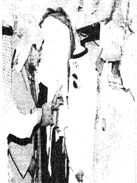
فقره المرحوم خلال زيارته التاريخية أماكن الفقراء.