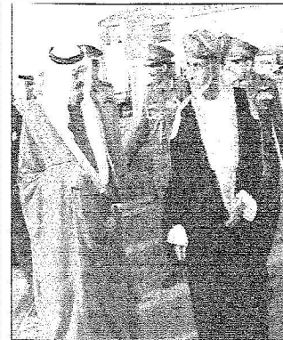
السلطان قابوس يستقبل خادم الحرمين لدى وصوله إلى مسقط