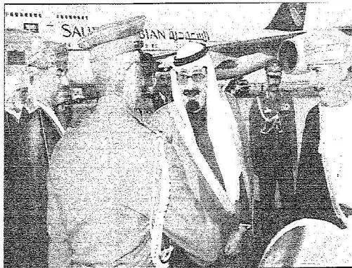
الملك عبدالله يصافح مستقبليه من أصحاب السمو والمعالي وكبار المسؤولين العمانيين