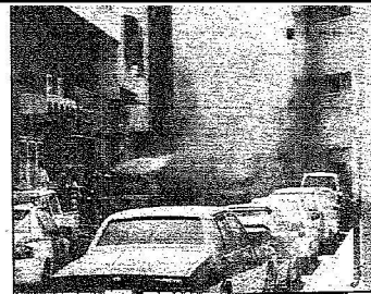
إحراق الحريق الذي تسبب في السيارات بعد تعرضها للقنابل الضالة بالمدينة