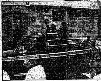
رجال الأمن أثناء متابعة المدينة حيث قُتل المطلوب صالح العوفي