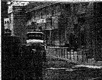
رجال الدفاع المدني أثناء تواجدهم في المواقع حيث تم إخلاء الشوارع سريعاً

المصدر : الرياض التاريخ : 19-08-2005 العدد : 13570 الصفحات : 7 المسلسل : 14