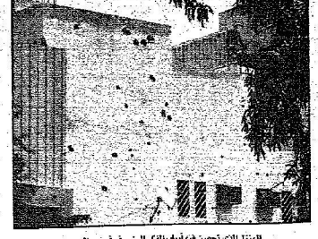
المنزل الذي تحصن فيه لوفيف، الفكر المشهور في حي الحسين

نجاحات أمنية جديدة في المدينة المنورة والرياض ..