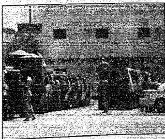
جانب من قوات الأمن المشتركة في مباحثة حي المصيف

عمل بطولي لرجال الأمن أثناء إخلاء المواطنين وأطفالهم