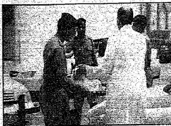
مواطن يقدم الماء لرجال الأمن بالرياض