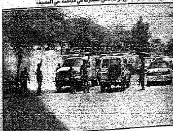
جانب من الطوق الأمني بحي المصيف