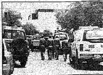
عدة جهات أمنية شاركت في مباحثة المصيف