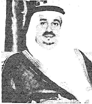
الأمير فيصل بن بندر