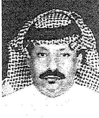
منور بن طعيصة

بالترحيب بخادم الحرمين الشريفين لزيارة القصيم فأهلاً وسهلاً به في أرض القصيم. كما تحدث رئيس مركز الأبرق الأستاذ عبدالله المغشي فقال: خادم الحرمين الشريفين حل ضيفاً على القصيم فأهلاً به أقولها اتصالاً عن نفسي ونيابة عن أهالي مركز الأبرق ونعو له بالتوفيق وأملنا أن يتحقق للمنتقلة الكثير من تاريخ هذه الزيارة. أما رئيس مركز علماء الأستاذ ماجد أبا الصفا فقال: اتصالاً عن نفسي ونيابة عن أهالي مركز علماء أقدم إلى مقام خادم الحرمين الشريفين بالترحيب بمناسبة الزيارة للمحسنة لمنطقة القصيم التي تشارك مناطق المملكة الفرحة هذه الأيام بزيارة ولي الأمر لها، نسأل الله لولي الأمر بالتوفيق.