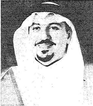
الأمير فيصل بن مشعل