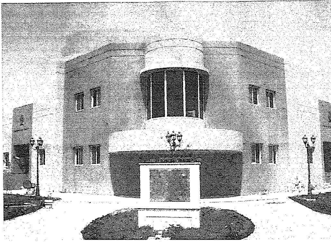
مركز صحي السلمانية الجديد

د. الشيخ الدكتور عبد الله بن عبدالعزيز (140) مركزاً صحياً جديداً بمختلف مناطق المملكة ويشتمل مركز صحي السلمانية