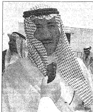
الامير بندر يتحدث لعكاظ