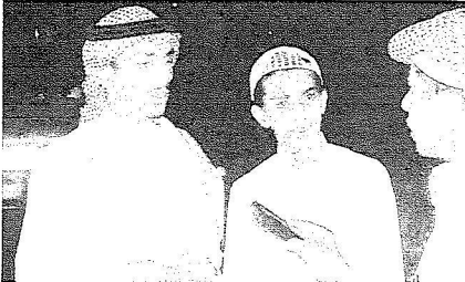
الجماهير في مكة تعبر عن سعادتها بالمكرمة