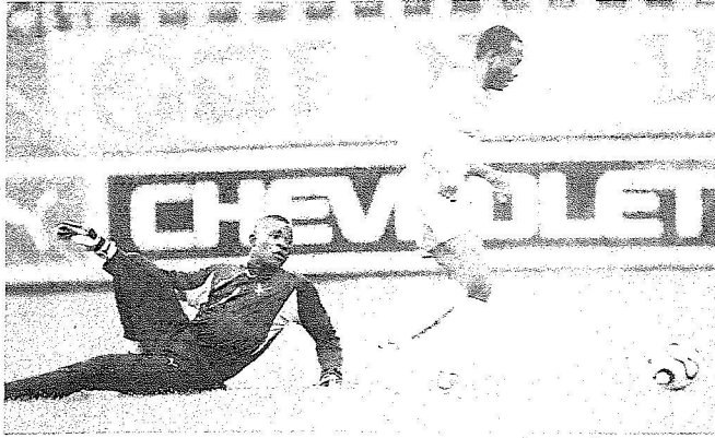
المكرمة انمكتت على أداء نجوم الأخضر