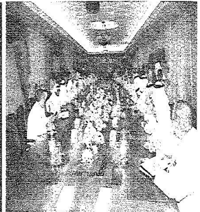
وكيل الإمارة يلتقي أعضاء المؤسسة