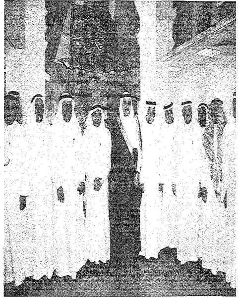
د الفضيري مع صورة جماعية مع أعضاء المؤسسة