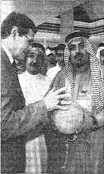
قاروب يديه كرة ٨-٢ الشهيرة