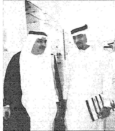
مدني وجمال تونسي في زيارة لمتحف الاتحاد بعد المنتدى