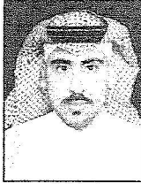
الشيخ زعل الشعلان