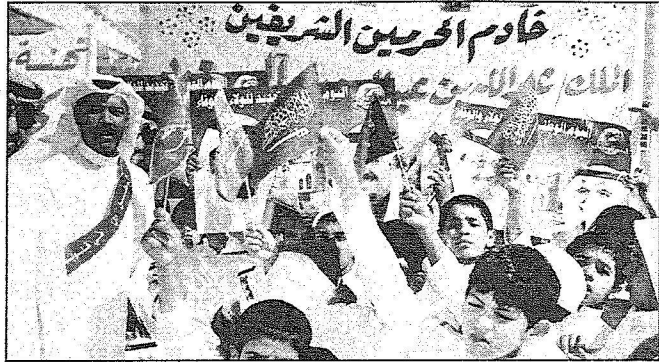
بعض طلاب المدارس يحتفلون بيقوم خادم الحرمين الشريفين

إن زيارة مولاي خادم الحرمين الشريفين الملك عبدالله بن عبدالعزيز آل سعود أيده الله ورعاه الحدود الشمالية هي تواصل لما شهنته هذه المنطقة كبقية مناطق المملكة من اهتمام غير محدود من قائد مسيرة البلاد وراعي نهضتها الذي عمل وعام الله منذ تولي مقاليد الحكم ومسؤولية إدارة نفة البلاد، وقيل ذلك حينما كان ولياً للمهد على نماء البلاد ورخاء الشعب ورفاهيته. وهذه الزيارة المباركة ستكون بياناً لله تعالى زيارة خير على المنطقة بمدنها ومحافظاتها ومراكزها، حيث عهدنا من لدن مولاي كل الاهتمام والحرص