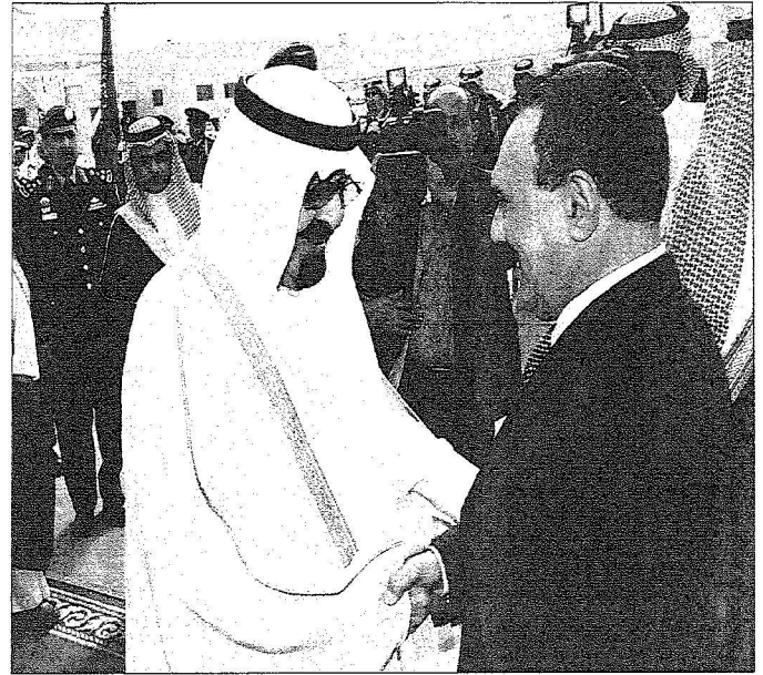
خادم الحرمين مستقبلا الرئيس اليمني في مطار قاعدة الرياض للجوية أمس.