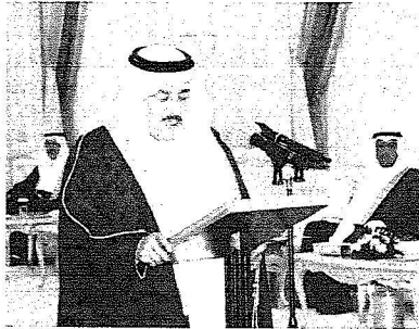
..وهنا الأمير نايف بؤدي القسم.

عبد الرحمن بلعظيم وزير الزراعة، الدكتور جبارة بن عبد الصريصري وزير النقل، المهندس محمد جميل بن أحمد ملا وزير الاتصالات وتقنية المعلومات، الدكتور حمد بن عبد الله المانع وزير الصحة، عبد الله بن أحمد يوسف زينل وزير الدولة عضو مجلس الوزراء، الدكتور سعود بن سعيد المتحمم وزير الدولة عضو مجلس الوزراء لشؤون مجلس الشورى، المهندس عبد الله بن عبد الرحمن الحصين وزير المياه والكهرباء، الدكتور عبد الله بن صالح العبيد وزير التربية والتعليم، عبد المحسن بن عبد العزيز العكاس وزير الشؤون الاجتماعية، وقد أقيم الوزراء باسمه بقول: "أقسم بالله العظيم أن أكون مخلصاً لديني، ثم لمليكي وبلادي، والآبوع يسر من أسرار الدولة، وأن أحافظ على مصالحها وأنظمتها، وأن أؤدي أعصابي بالصنق والأمانة والإخلاص .