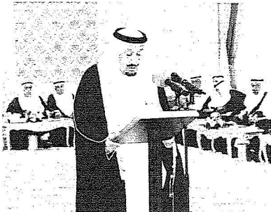
الأمير متعب بؤدي القسم.

بن محمد المنقري وزير التعليم العالى، الدكتور مطلب بن عبد الله النفيسة وزير دولة عضو مجلس الوزراء، مساعد بن محمد العيبان وزير الدولة عضو مجلس الوزراء، الدكتور غازى بن عبد الرحمن القصيبي وزير العمل، الأستاذ محمد بن على الشايز وزير الخدمة المدنية، الدكتور خالد