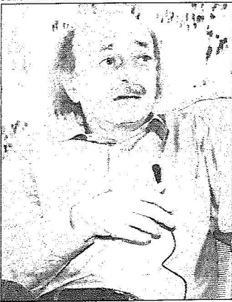
جنلاط الله الحوار

- مات فؤاد شهاب مع الأسف، وظروف فؤاد شهاب تغيرت وظروف العالم العربي أيضاً تغيرت، مرشح التسوية (شخصياً) ملتزم بفريق العمل.. حفائفي في 14 مارس.