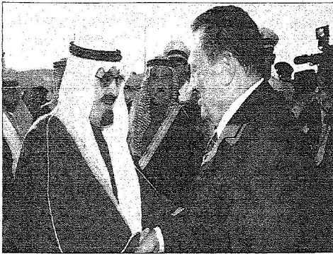
الملك خلال استقباله مبارك

وعقب استراحة قصيرة في صالة التشريفات بالطمار صبح خادم الحرمين الشريفين الملك عبدالله بن عبدالعزيز آل سعود أخاه فخامة الرئيس محمد حسني مبارك في موكب رسمي إلى قصر خادم الحرمين الشريفين. ويضم الوفد الرسمي العراقي لفخامة الرئيس المصري كل من معالي وزير الخارجية الأستاذ أحمد أبو الغيط ومعالي وزير الإعلام الأستاذ أنس فقي ومعالي رئيس