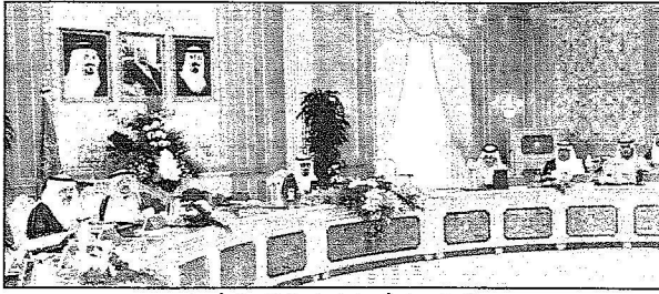
خادم الحرمين يرأس جلسة مجلس الوزراء..