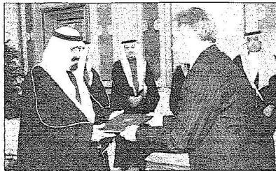
خادم الحرمين الشريفين يتسلم أوراق اعتماد عدد من سفراء الدول الإسلامية والصديقة

الحرمين الشريفين على الجهود التي يقوم بها شخصياً وكذلك الانجازات التي سجلتها المملكة العربية السعودية في كافة ميادين الحياة تحت قيادة خادم الحرمين الشريفين الحكيمه . وقال : نحن بدورنا كسفراء ممتدنين هنا لا يسعنا إلا أن نعاذكم عهد الرجال الأوفياء بأن نعمل جاهدين على تعزيز وتقوية وتعمية العلاقات في كافة المجالات التي تربط بين بلداننا المختلفة وإمالة العربية السعودية . وأشار السفير إلى أنגיע