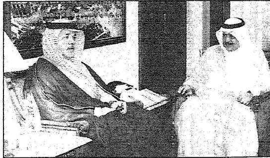
الأمير نايف خلال استقبائه وزير الحج

مكة المكرمة - وائل اللهيبي، خالد عبدالله جدو - و.أ.س : ■ استقبال صاحب السمو الملكي الأمير نايف بن عبدالعزيز وزير الداخلية رئيس لجنة الحج العليا بمكتب سموه مساء امس بجدة معالي وزير الحج الدكتور فؤاد بن عبدالسلام الفارسي وممثلي ارباب الطوائف من مطوفين وادلاء وزمارة وكلاء.