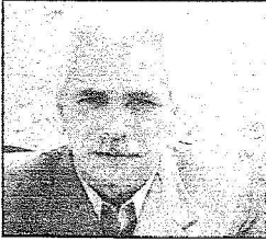
وزير الشؤون الاجتماعية السابق في كشمير

سيد حشيم يعرب عن شكره للأمير نايف المشرف العام على الحملة الشعبية السعودية