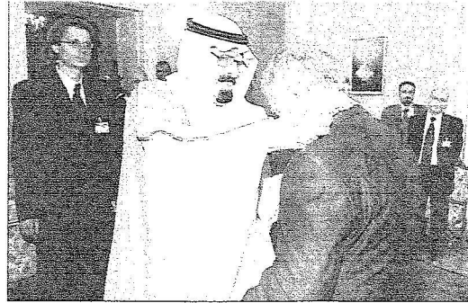
خادم الحرمين يقفد الرئيس البولندي قلادة الملك عبد العزيز

الرئيس البولندي يقيم حفل عشاء تكريمي لخادم الحرمين الشريفين في القلعة الملكية