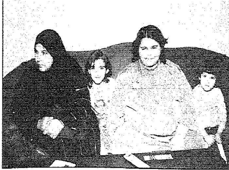
برادة شقيقة تقي