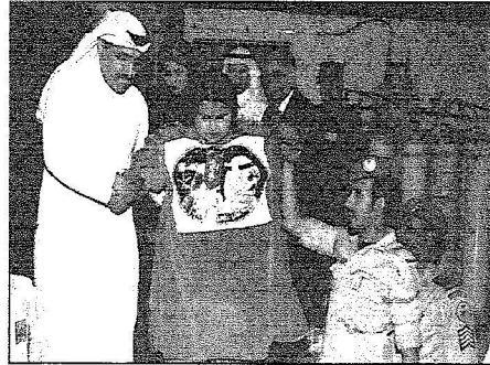
لمحة وصول تقي