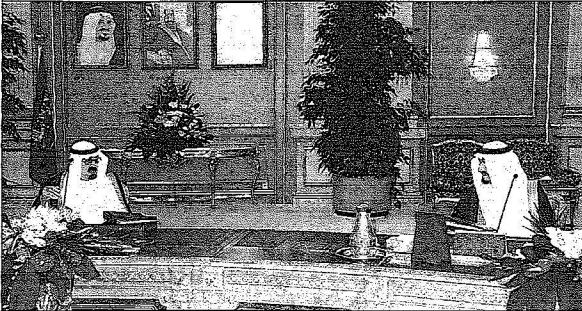
جلسة مجلس الوزراء برئاسة خادم الحرمين الشريفين