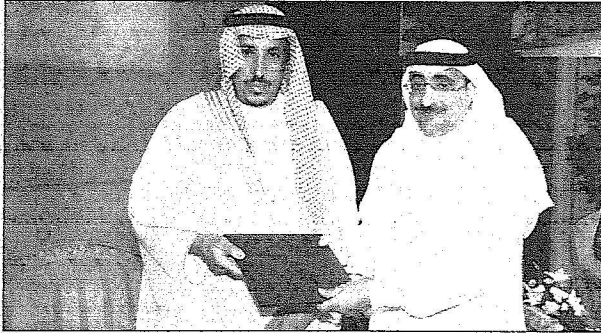
الأمير سعود يسلم المحرر درع تكريم «اليوم»

وعن الخطة الإستراتيجية التي ستتتبعها الهيئة للكية بعد ندوة رؤى التعليم والتدريب، قال سموه منذ قيام الهيئة هناك خطة إستراتيجية وهناك تخطيط للاستفادة من القوى البشرية السعودية. وبعد هذه الندوة سوف نعيد النظر في متطلبات السوق، وكذلك إعادة النظر في خططنا السابقة، ودائما المؤسسات الخية هي التي تعيد النظر في خططها لتوفير الكوادر المطلوبة المؤهلة، ولابد من تحية الشباب السعودي الذين نحسوا في تحقيق خططنا بتأهيلهم والشباب السعودي إذا أخذ الفرصة يكون قادرا على إدارة دقة العمل، يوما نشهده في قيادة الصناعات سواء في الجبيل وينبع وتجاهه مفعرة لكل سعودي. ودخل مشروع الهيئة للكية للجبيل وينبع الطموح للسعودة الذي تبنته الهيئة، قال سموه نعمل بشكل كبير على ان تأهيل الانسان أيضا على ان تكون عقود العمل تناسب بيئة ومتطلبات الشاب السعودي، واعتقد أننا قطعنا شوطا كبيرا في هذا المجال وطموحنا أكبر.