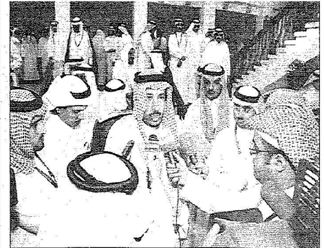
الأمير سعود بن ثنيان يدلي بتصريحات للصحفيين

الأمير سعود بن ثنيان يفتتح فعاليات ندوة «رؤى التعليم والتدريب»