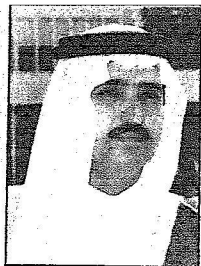
الأمير أحمد بن عبدالعزيز