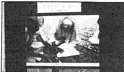
طالبات محو الأمية في أوجة تذكارية