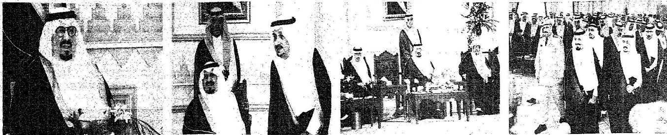
الأمير سلطان يشرف حفل إمارة القصيم

الأهالي : القصيم بفضل دعم القيادة أصبحت معلماً حضارياً ووجهاً اقتصادياً ومنطقة جاذبة للاستثمار