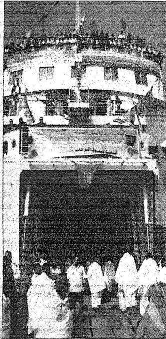
فخح الحجاج الواصل امس