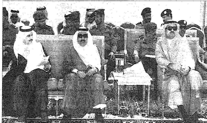
الامير مشعل وزير النقل خلال المناسبة