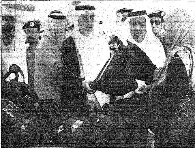
سموه يستقبل الحجاج بالهدايا