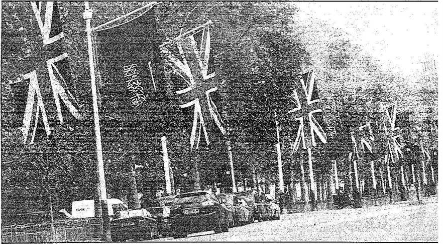
علماء المملكة وبريطانيا يرفغان في شارع بوسط لندن (العب)

رئيس دائرة الشرق الأوسط بالخارجية البريطانية: