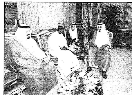
الملك عبدالله مستقبلاً وزير التعليم العالي ومديري الجامعات