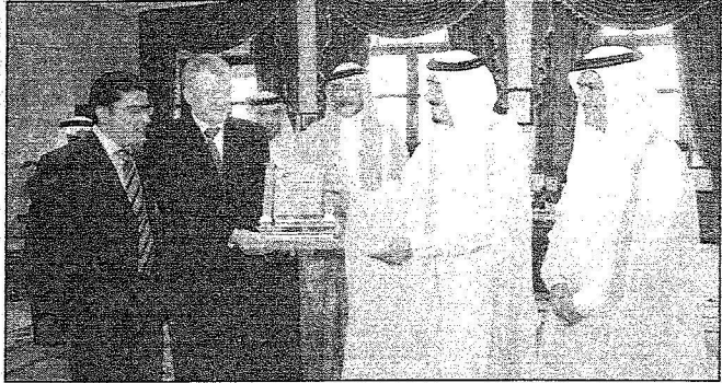
الأمير سلمان يتسلم برع الشركة المتبرعة

حث الجمعية بالتعاون مع مؤسسة سليمان الراجحي الخيرية على إقامة للمنتقى الأول لرعاية الأيتام لأهمية التقاء المختصين وعرض التجارب والتعرف على الإنجازات والحديث في هذا المجال سواء الحكومي منها أو الأهلي محلياً وعالمياً والعمل على تطوير الخدمات المقدمة للأيتام. وأضاف أن المنتدى يتضمن خمسة محاور رئيسية في رعاية الأيتام في الإسلام من حيث حقوقه ومراتبه ورعايته خلال التاريخ الإسلامي منذ عهد الخلافة الراشدة، والمحور الثاني حاجات الأيتام وأسرههم ووسائل تحقيقها سواء النفسية أو الاجتماعية أو التربوية أو الاقتصادية، ويتعلق المحور الثالث بأثر الغياب الأبوي وكيف يمكن تعويضه، أما المحور الرابع فيتعلق بأنماط الرعاية المقدمة لليتيم في المملكة وتجارب الدول العربية والعالية، ويتطرق المحور الخامس لسبل دعم جمعيات الأيتام وتطويرها من حيث الموارد المالية والبشرية والمعدات والحوافز الإيجابية وتنسيق الجهود المشتركة وقدم د. البدر شكره وتقديره للأمير سلمان بن عبدالعزيز على رعايته الكريمة ودعمه الكبير لتنظيم هذا المنتدى إيماناً من سموه لأهمية مثل هذه المناسبات التي تسهم في تقديم خدمات مميزة لفئة أبنائه الأيتام كما قدم شكره مؤسسة سليمان الراجحي الخيرية على رعايته وتكفلها بالرعاية الشاملة للمنتقى وموجهها دعواته لكل المختصين والمهتمين بقطاع العمل الخيري وخصوصاً المتعلقة بالأيتام للمشاركة وإثراء محاور المنتدى الفعالة ويتحقق الهدف المنشود من تنظيمه. وأوضح أن الجمعية تحضن حالياً أكثر من ٢١٥٠٠ يتيم وتزيمه وتدرس حالياً إنشاء ثلاثة فروع جديدة في محافظات الأحواز والوادي والرفيعة بعد أن بدأ فرع محافظة الخرج عمله قبل سنة من الآن حيث يستعمل رعاية الأيتام في كافة مجالاتها التعليمية والاجتماعية.