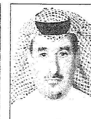
سلطان محمد الهاجري

وتوفيقه وأدام على هذه البلاد نعمة الأمن والرخاء وأعرب عضو الغرفة التجارية ورجل الأعمال الأستاذ محمد بن حسن الهاجري عن سعادته البالغة بخير عودة ولي العهد صاحب السمو الملكي الأمير سلطان بن عبد العزيز - حفظه الله - لأرض الوطن عندما قال: "إنه من أسعد الأيام أن يعود الأمير سلطان لأرض الوطن، وفرحة كبيرة للشعب السعودي بعونه سالماً معافى ويسرنى أن هنى خادم الحرمين والأسرة المالكة الكريمة