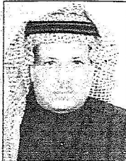
سلطان صالح الهاجري

* وتحدث الأستاذ ابراهيم بن محمد الهاجري فقال : لم يكن عطاء سموه مقتصراً على مجال واحد أو بلد واحد... فهو عطاء أشبه بالهدير الجاري فمن قلب نجد إلى أقاصي أسغال أفريقيا كانت رحلة الخير ولا زالت يقودها سموه الكريم، الذي عرف بجهوده وكرمه وعظمته ففي كل بقعة من بلداننا لعطاء سموه بصمة فمن الإسكان الخيري... إلى بناء المستشفيات إلى نقل المرضى إلى حفر الآبار، نقلنا المشاهد التي لا يمكن حصرها... أذك لعظمة لا تتقطع في مد الخير لكل محتاج ولكل إنسان عانى بسفوة الحياة ومن هنا زرع الحب الذي شاهدناه وحظي به من المواطنين.