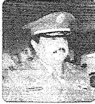
يقلم اللواء سالم ابن محمد البليهد *

« تقدر كثيراً المهام التي يبدلها الإعلام في أبحر انجازاتنا الوطنية، ولعل صحيفة «الرياض» السباق دائماً الى رصد جهودنا الميدانية وعلى وجه الخصوص