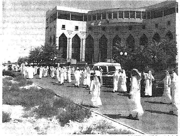
العمل على تدعيم الملاقة بين غرفة الشرقية ومنتسبيها ( اليوم)