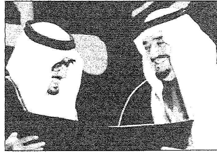
الملك فهد خلال تسلم جائزة خدمة الإسلام في عام (1404هـ - 1984م)