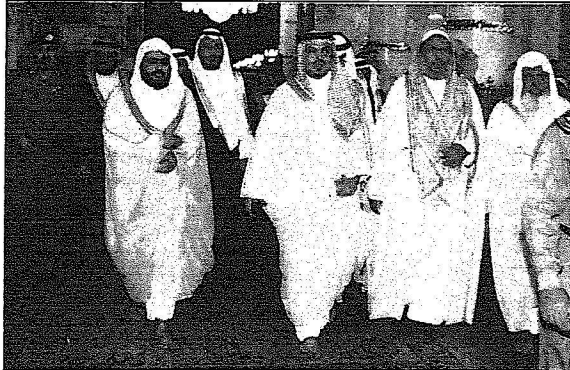
سمو يشرف بالسلام على الرسول صلى الله عليه وسلم

هذا وقد رحب معالي امين المدينة المنورة المهندس عبدالعزيز الحصين بسمو الأمير عبدالعزيز بن ماجد متمنياً له التوفيق والنجاح في مهمته التي اولاهها اياه خادم الحرمين الشريفين وهو اهل لها بإذن الله وما أنجزه في منطقة القصيم