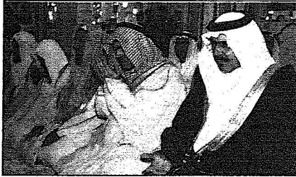
سموه يصلي ركعتين في المسجد النبوي