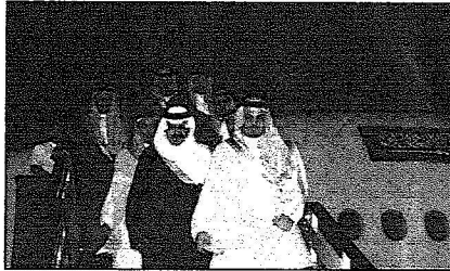
سموه لحظة هبوطه من الطائرة